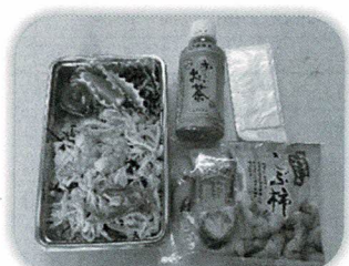
テイクアウトのお弁当・お菓子

コミュニティルームまで歩く事を第一の目的として、3年ぶりに開催いたしました。中央地域包括支援センターの方による体操、射的・輪投げ・血圧握力測定コーナーと長居はせず、自由に遊んでいただきました。お弁当受け取りだけの方もあり、無事に終了いたしました。ボランティアも久しぶりの弁当作りに戸惑いながら楽しく調理しました。顔を会わせる行事は心弾みます。ばら寿司美味しかったよとの嬉しいお声も届きました。皆さまお元気でお過ごしください。来年の開催を楽しみに!!