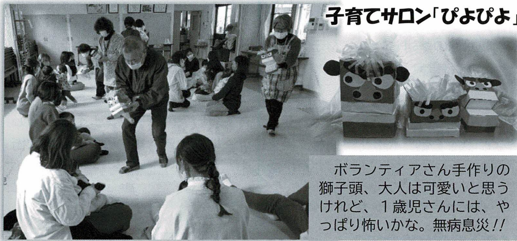
子育てサロン「ぴよぴよ」

ボランティアさん手作りの獅子頭、大人は可愛いと思うけれど、1歳児さんには、やっぱり怖いかな。無病息災!!