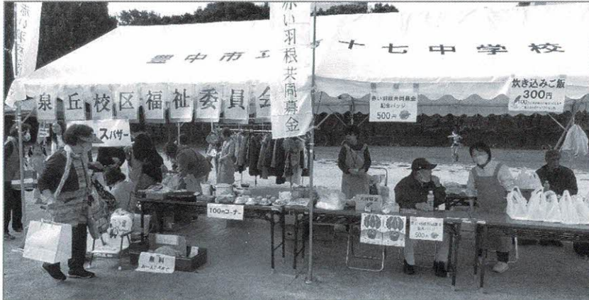
子ども服・おもちゃ、日用品、洋服、福祉委員会のコーナーは掘り出し物がいっぱい、楽しんでいただけたようです。