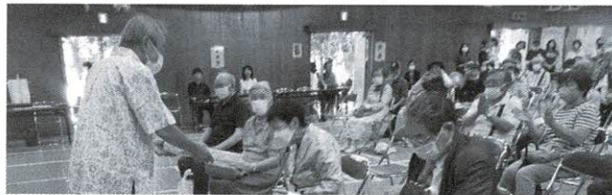
ご長寿おめでとうございます 泉丘校区 88歳42人、99歳4人