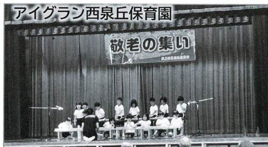
アイグラン西泉丘保育園