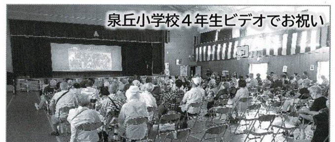
泉丘小学校4年生ビデオでお祝い