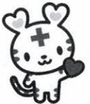
日本赤十字募金 キャラクター ハートラちゃん